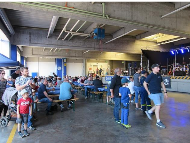
In der Fahrzeughalle.