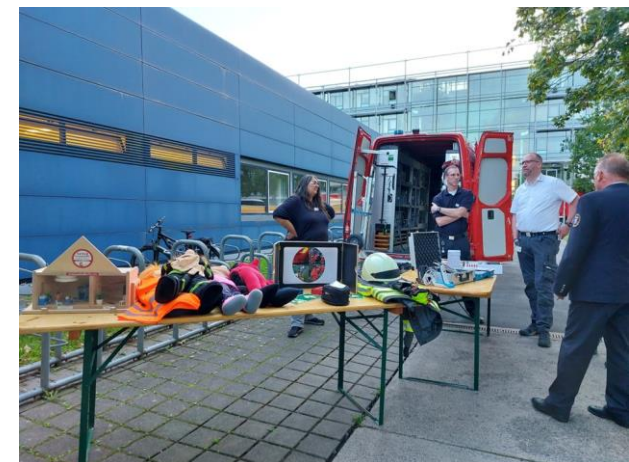
Bild unten rechts: Das Fahrzeug mit Ausstattung zur Brandschutzerziehung und Brandschutzaufklärung des Landkreises Gießen. Im Zuge einer Landesbeschaffung wird jeder Landkreis ein solches Fahrzeug erhalten.