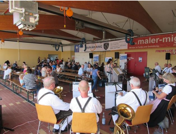
Die "Werdorfer Blasmusik" unterhielt die Gäste vor und in der Fahrzeughalle.

Freiwillige Feuerwehr Aßlar – 10.09.2023 – „Tag der offenen Tür“ mit Fahrzeugübergabe