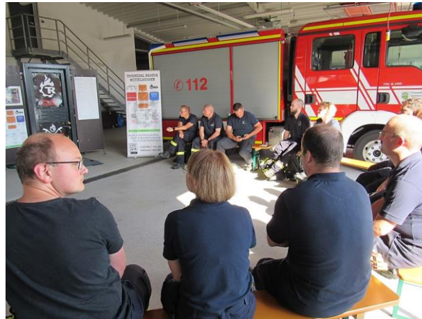
Einige der Teilnehmenden.