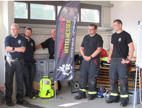
Eröffnung des Seminars.

Hüttenberg-Volpertshausen – 14.06.2023 – Praxisseminar „Notfallmäßige Türöffnung“