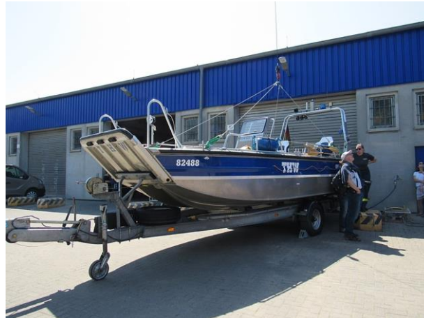
THW-Ortsverband Gießen mit einem Boot