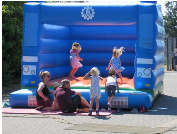
Aktiv sein und mitmachen – kleinerer Kinder auf der Hüpfburg, größere am Kletterturm.