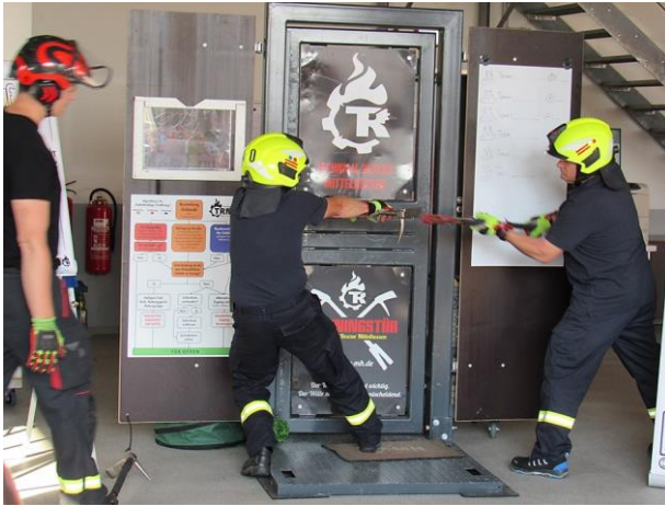
Hände oben beim Halten des Halligan-Tools und Schlagen.

Hüttenberg-Volpertshausen – 14.06.2023 – Praxisseminar „Notfallmäßige Türöffnung“