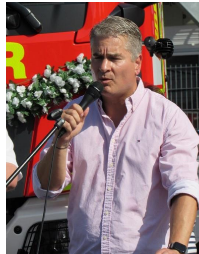
Bürgermeister Christian Schwarz