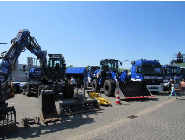
THW-Ortsverband Dillenburg mit Bagger und Radlader

04.06.2023 – THW - Ortsverband Wetzlar – Jubiläumsfeier mit einem „Tag der offenen Tür“