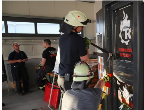
Halligan-Tool ansetzen, sichern mit der Axt.