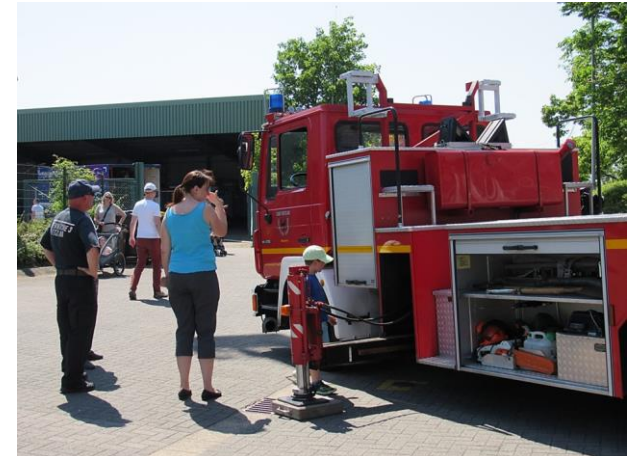
Feuerwehr Wetzlar-Büblingshausen mit der Drehleiter DLK 23/12