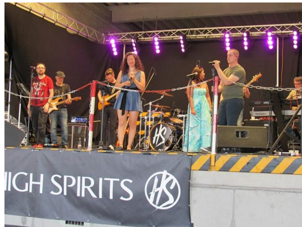
Die Gruppe „High Spirits“ auf der Bühne.